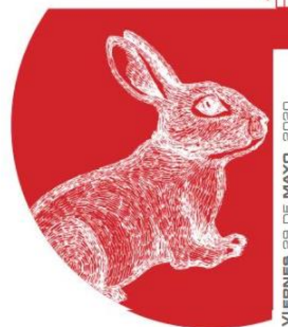
Facebook El conejo y su amigo en la Luna